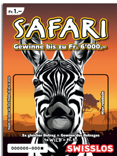
Esempio: La vincita è di Fr. 20.-