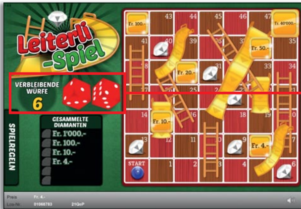
Beispiel: Gewinn Fr. 4.-