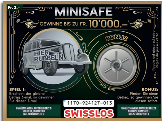
Beispiel Spiel 1: Gewinn Fr. 10.-