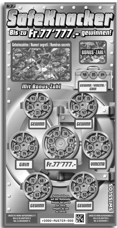
Beispiel: Gewinn Fr. 14.-