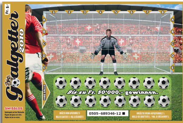
Beispiel: Gewinn Fr. 50'000.-